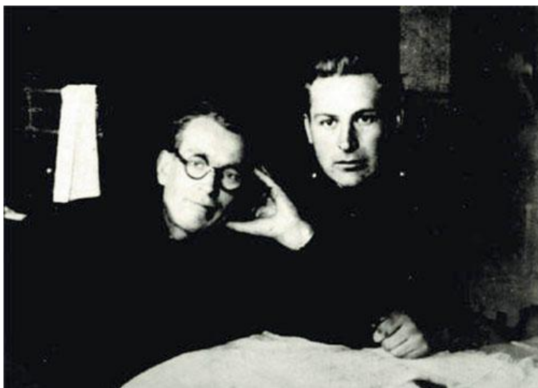
А. Фатьянов (справа) и В. Соловьев-Седой . 1942 г.

разговаривал один на один со своим сверстником-солдатом о самом важном, самом сокровенном. И этот душевный разговор о девчатах, о баяне, о соловье, о друзьях-однополчанах, о деревенском садочке был подкупающе трогателен, брал за душу».