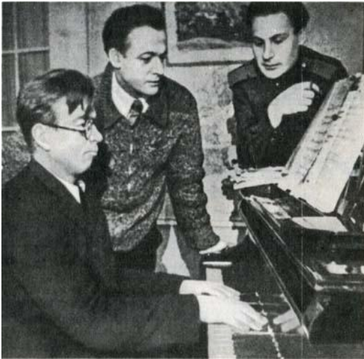
Соловьев-Седой проигрывает С. Лемешеву и А. Фатьянову вновь сочиненную песню «Соловьи»

Песня «Соловьи» появилась своевременно. Она сразу покорила фронтовиков своей искренностью и задушевностью.