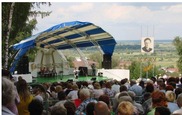
На Фатьяновской площадке. 2008 г.