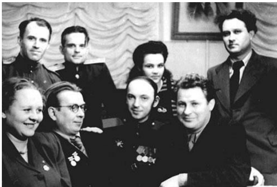
В. Соловьев-Седой (1-й ряд, 2-й слева), А. Фатьянов (1-й ряд, 1-й справа), Б. Мокроусов (2-й ряд, справа)